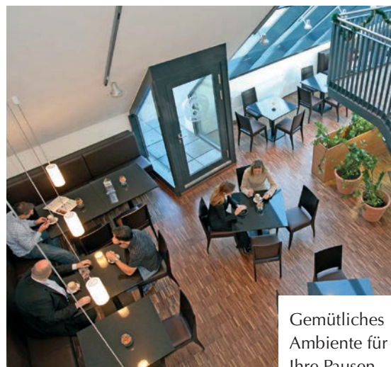
Gemütliches Ambiente für Ihre Pausen.