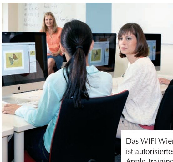
Das WIFI Wien ist autorisiertes Apple Training Center.

Sie erreichen uns mit dem Fahrrad oder E-Bike: Gürtelradweg öffentliche Radständer: Eingang A sowie Eingang Semperstraße. Ladestation für E-Bike in der Semperstraße sowie beim Eingang A.