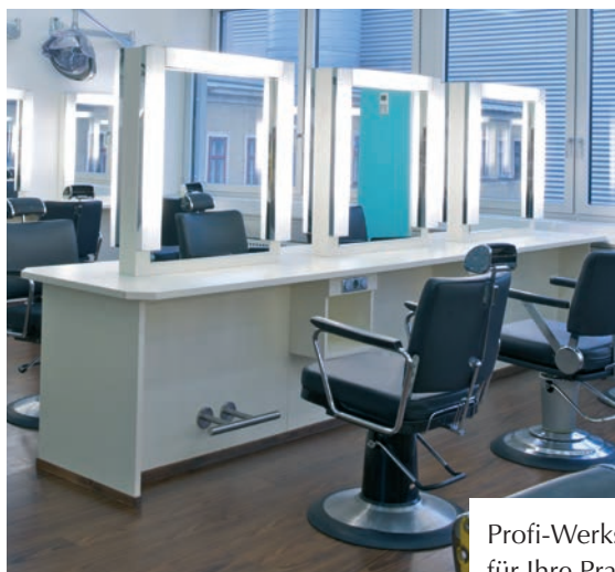
Profi-Werkstätten für Ihre Praxis.

Kursraum per SMS finden: Schicken Sie an 0676 660 1030 ein SMS mit einem Fragezeichen und Ih- rer achtstelligen Buchungs-Nummer. SMS-Gebühr lt. Ihrem Tarifvertrag.