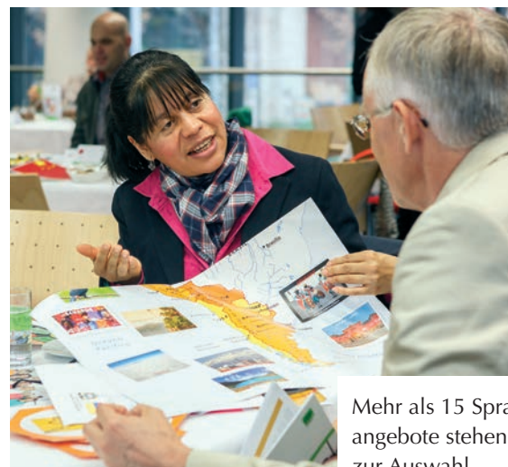
Mehr als 15 Sprach- angebote stehen Ihnen zur Auswahl.