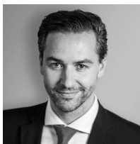
Mag. Johannes Klaus Wiener Börse AG